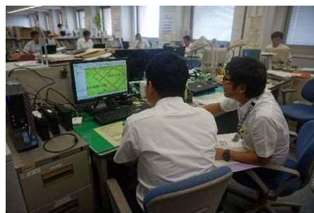
職員に教えてもらいながら作業する様子